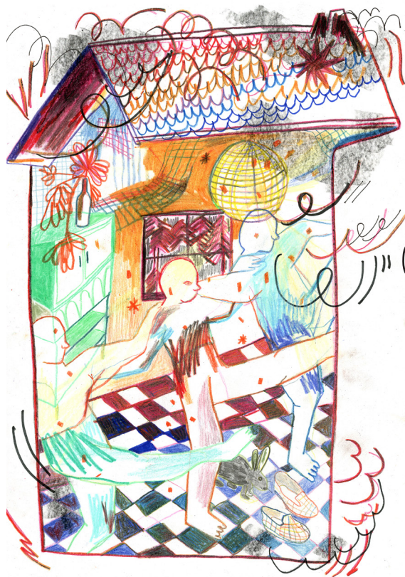
Illustrations : Louise Doumeng